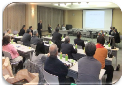
・誰でも気軽に参加できる例会

私達の例会は 第1例会・・・第1水曜日12:15～ 第2例会・・・第3水曜日19:00～ ユーホール（四国中央市土居文化会館）にて行なっています。エコへの配慮と誰にでも参加しやすく楽しい例会作りのためプロジェクターを使って「画像」「音楽」等を盛り込んだ『プロジェクター例会』『完全ペーパーレス例会』を開催しています。